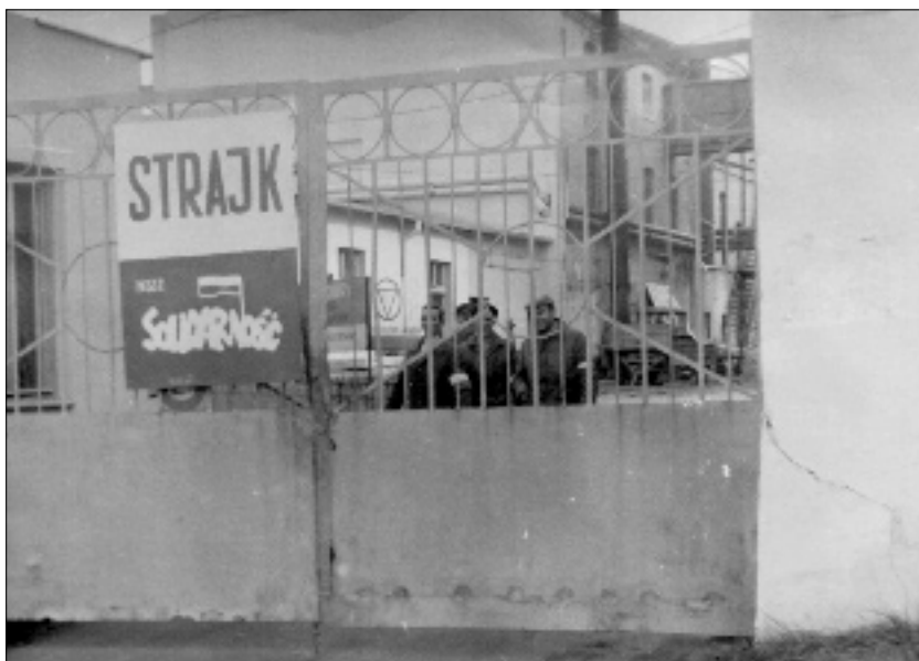
Strajk 27 marca 1981 r. w ZPM im. Gwardii Ludowej - Zakład 2.