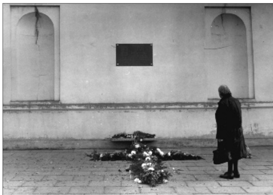
Krzyż kwiatowy przy Kościele p.w. św. Lamberta w Radomsku.

13 grudnia gen. Jaruzelski wprowadził stan wojenny, zdelegalizował „Solidarność” i uwięził działaczy Związku. W Radomsku internowano 8 osób, przebywali oni w dwóch obozach - najpierw w Sierdzu, potem w Łowiczu.