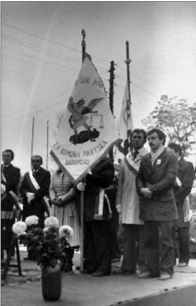
Poświęcenie sztandaru „Solidarności” ZP „Komuna Paryska”.