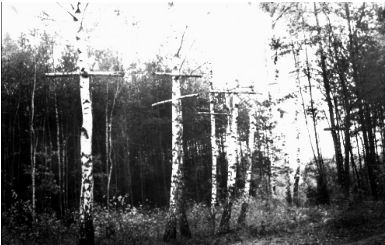
9 krzyży brzozowych w Podświerku.