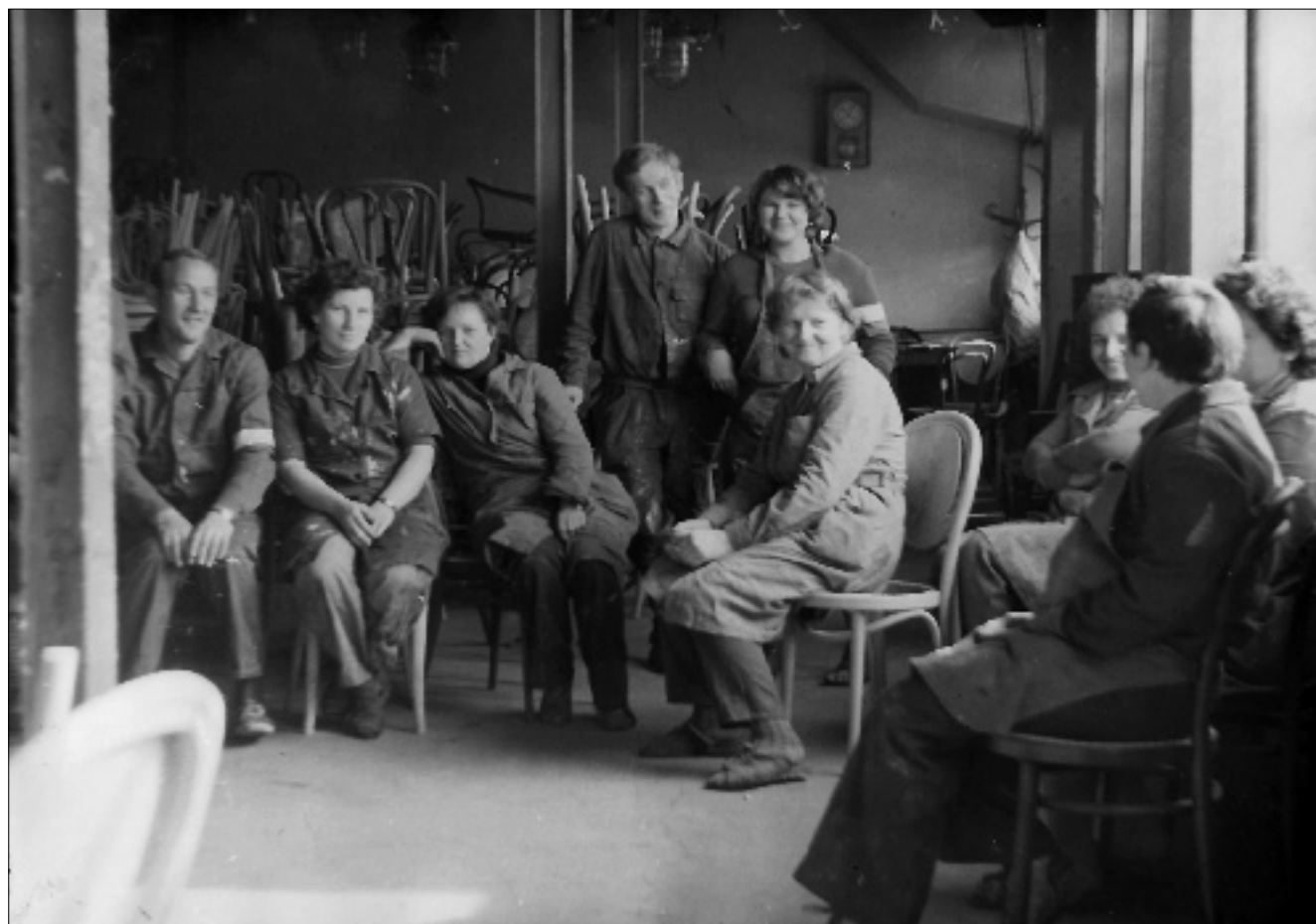
Strajk 27 marca 1981 r. w ZPM im. Gwardii Ludowej - Zakład 3.

W kwietniu i na początku maja Delegatura w Radomsku decydowała o przynależności regionalnej. Jej przedstawiciele przeprowadzili rozmowy z RKZ Częstochowa, MKZ Ziemi Łódzkiej oraz MKZ województwa piotrkowskiego. Częstochowa zaoferowała najlepsze warunki - samorządność i autonomię