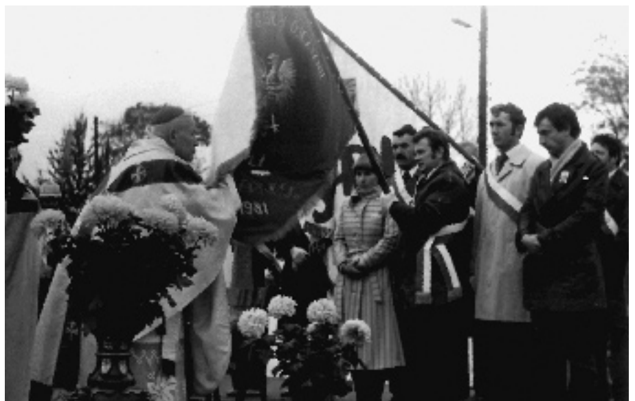
Poświęcenie sztandaru „Solidarności” ZP „Komuna Paryska”.